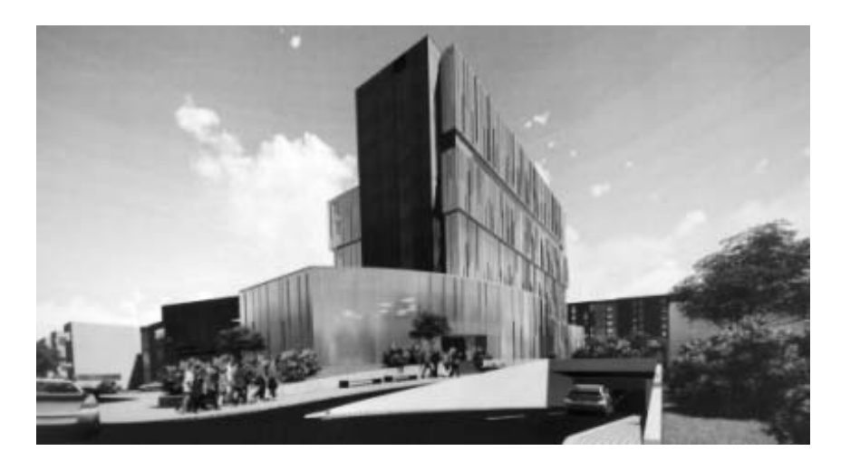
Рисунок 4. Вигляд за ескізним проектом в'їзної та виїзної групи до підземного паркінгу на 141 машиномісце.

стоянки для тимчасового зберігання автомобілів працівників лікарні на 38 машиномісць, яка розміщена на відстані 32,5 м від будівлі лікарні, що дотримує нормативну санітарну відстань у 25 м за Додатком №10 «Розриви від наземних відкритих автостоянок» ДСП №173-96.