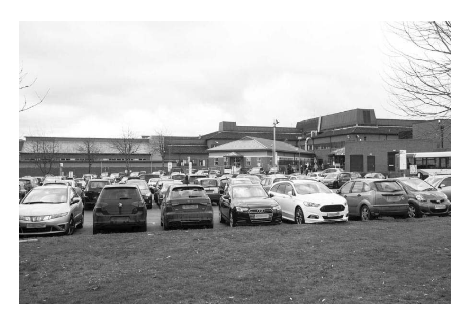
Рисунок 3. Вигляд наземної відкритої багаторядної автостоянки лікарні «Lincoln County Hospital» (США).

Сучасне будівництво закладів охорони здоров'я приватної форми власності в Україні здійснюється за індивідуальними проектами із запозиченням міжнародного досвіду в частині використання підземного простору території для зберігання автотранспорту.