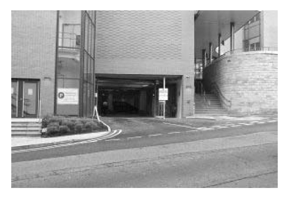
Рисунок 2. Вигляд в'їзної та виїзної групи до паркінгу дитячої лікарні «Sheffield Children's Hospital» (Велика Британія).

На рисунку 2 зображено розміщення автомобільного паркінгу під будівлею дитячої лікарні [8].